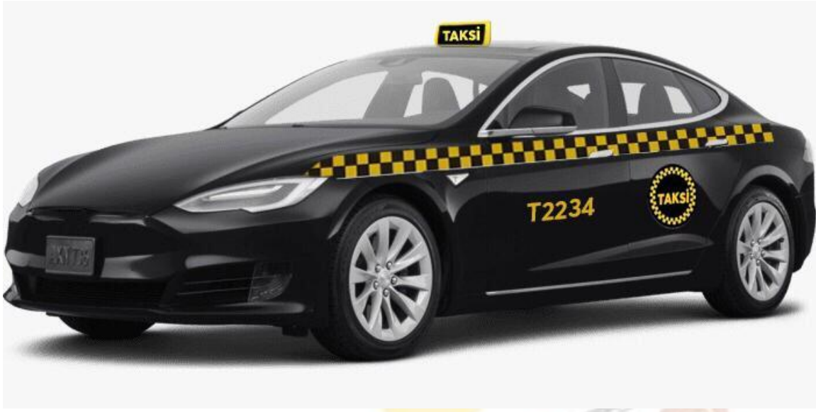
Şekil 4: "D" segment üstü siyah renkli taksi