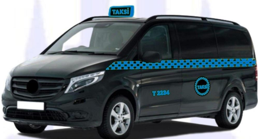
Şekil 5: İhale metodu ile kiralanın 8+1 koltuk kapasiteli siyah renkli taksi