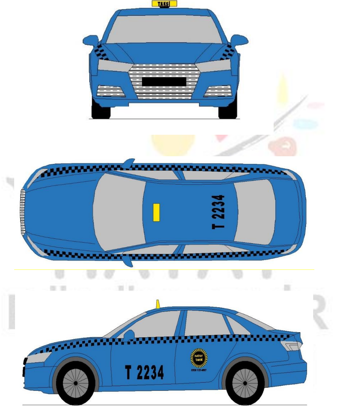
Şekil 2: İhale Metodu ile Kiralanan 5012 RAL Kodlu Taksi