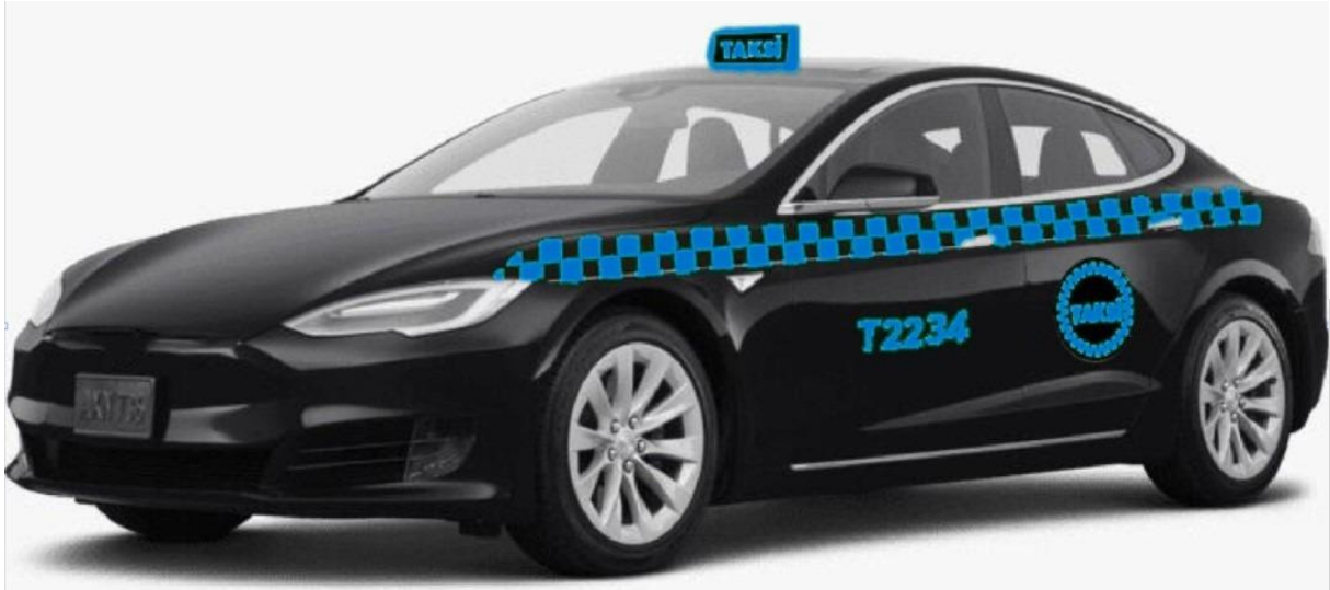
Şekil 6: İhale metodu ile kiralananan “D” segment üstü siyah renkli taksi