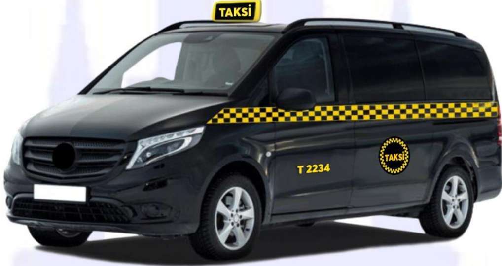
Şekil 3: 8+1 koltuk kapasiteli siyah renkli taksi