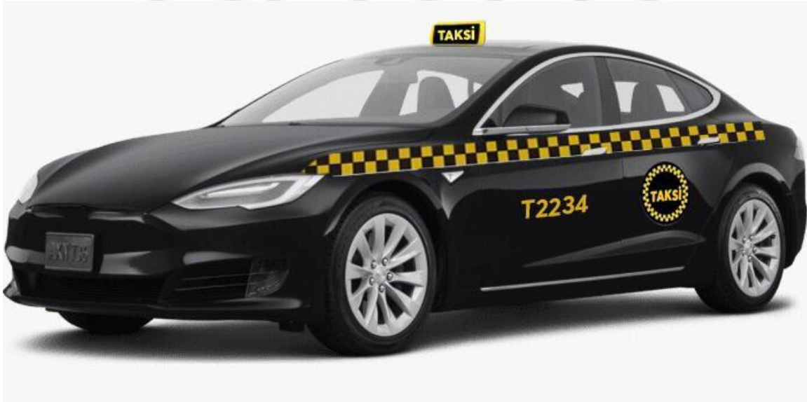
Şekil 4: "D" segment üstü siyah renkli taksi