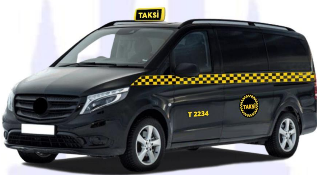
Şekil 3: 8+1 koltuk kapasiteli siyah renkli taksi