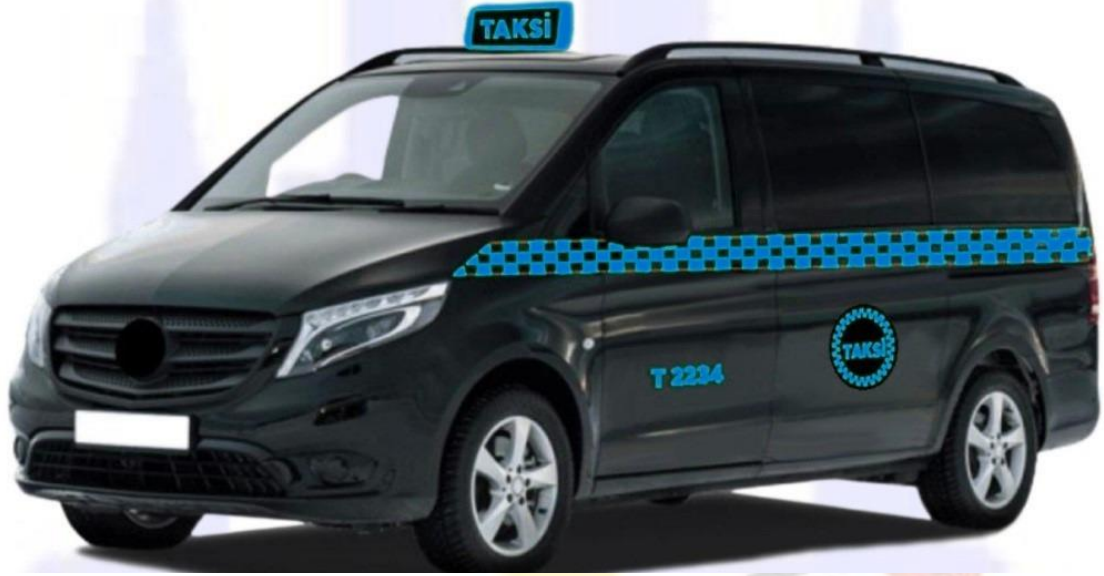
Şekil 5: İhale metodu ile kiralanılan 8+1 koltuk kapasiteli siyah renkli taksi