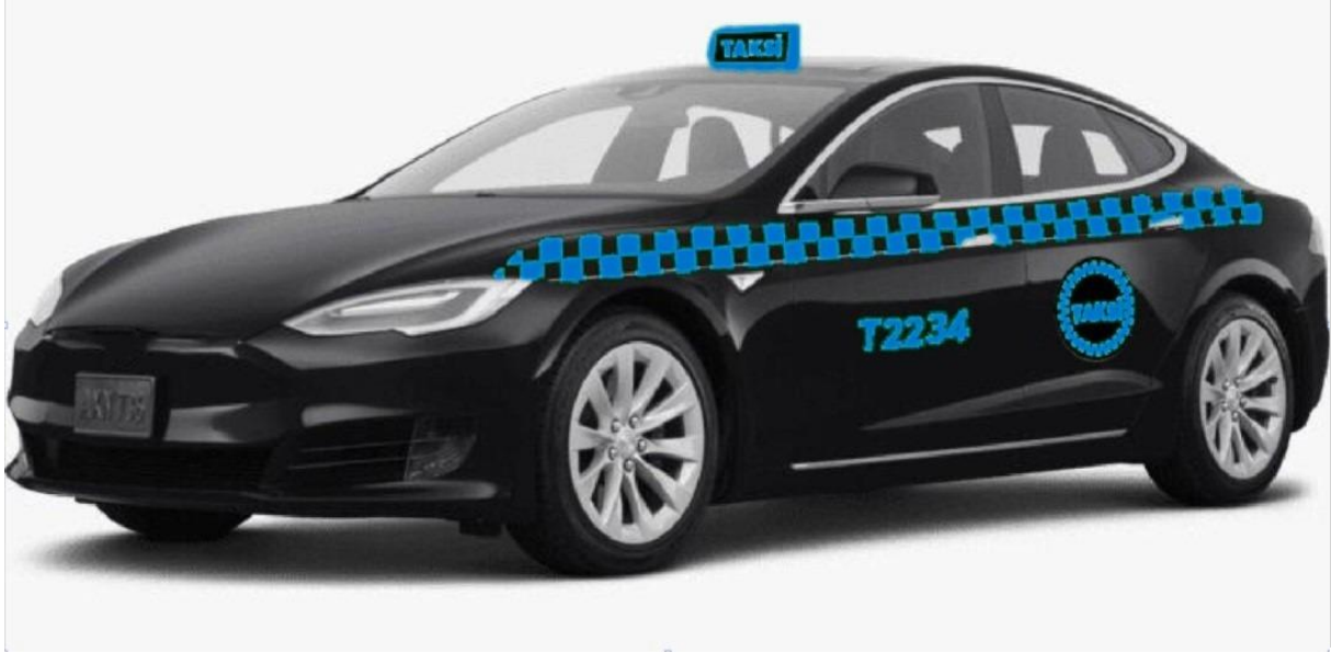
Şekil 6: İhale metodu ile kiralanılan "D" segment üstü siyah renkli taksi